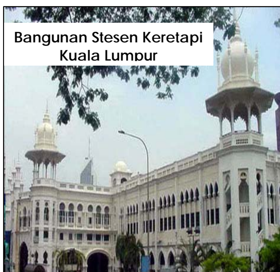
Bangunan Stesen Keretapi Kuala Lumpur