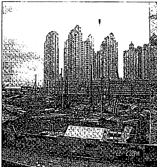
Memajukan ekonomi negara