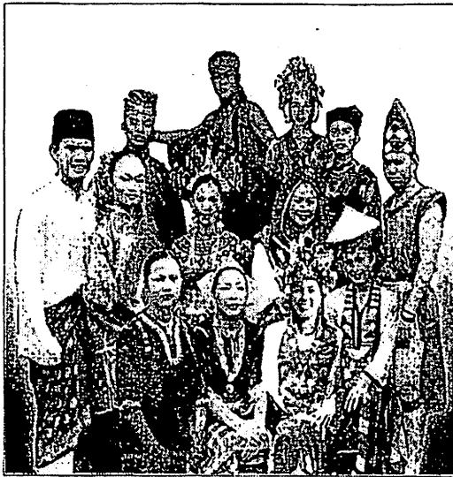
Mewujudkan masyarakat harmoni

Lihat gambar di bawah dengan teliti. Huraikan pendapat anda tentang kepentingan mengamalkan perpaduan kaum di Malaysia . Panjangnya huraian hendaklah antara 200 hingga 250 patah perkataan.