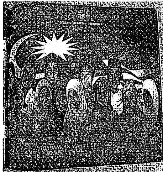
Meningkatkan keamanan negara