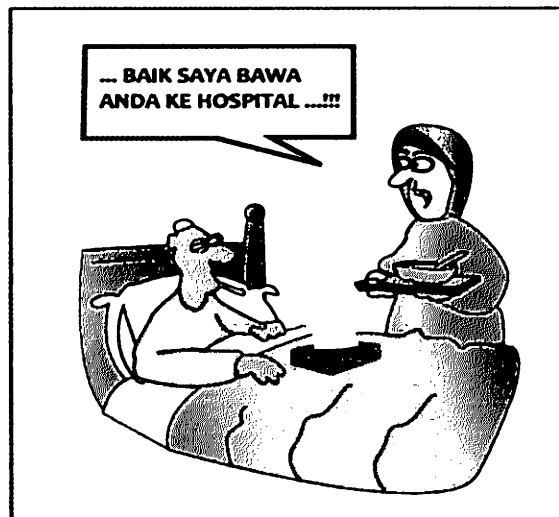
Membantu jiran mendapatkan rawatan