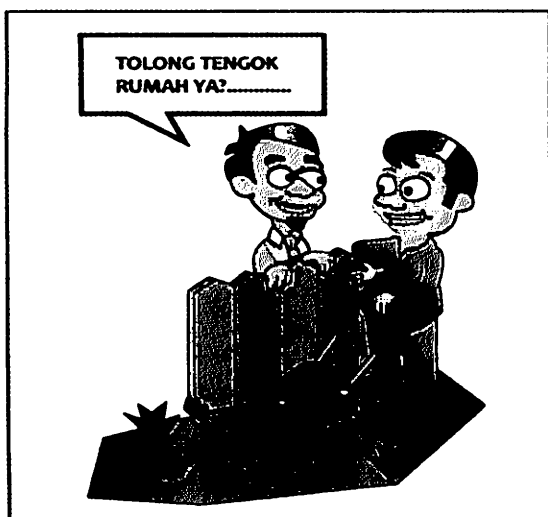
Mengurangkan kes jenayah